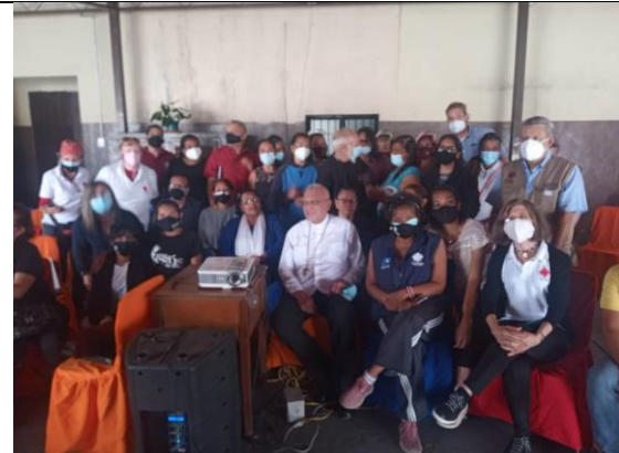
Participantes del Taller de Formación