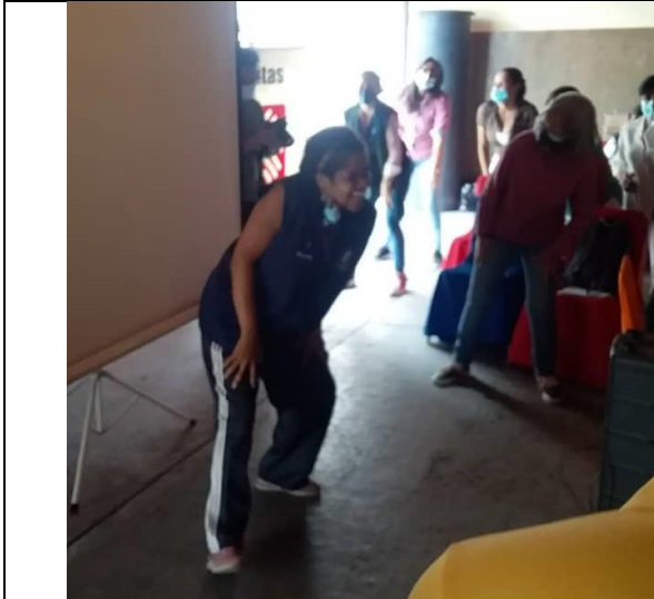
Dinámica de Inicio "POWER WALKING"

Apostólico de la Arquidiócesis de Caracas y la canción Que bonita es esta vida y Venezuela.