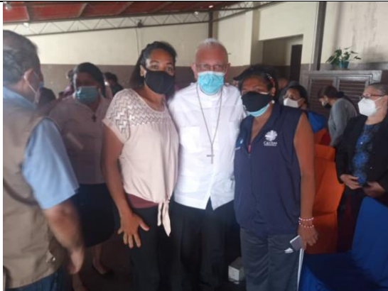
Con el Cardenal Baltazar Porrás